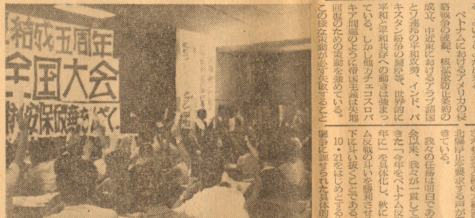
満場一致で草案採択される