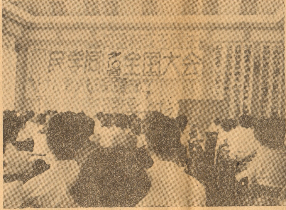
全国から多数の同志の参加の下、熱心な討論

「南緯」は、東南アジアへの新民主主義的進出をねらうものであり、これは資本主義の全般的危機、日本帝国主義そのものの矛盾の反映である。 ③ 米軍の国民の反感、それを支えようとする支配体制そのものの危機に発展しかねない問題を如何に処理するか、それは、駐留体制の歴史、基地の縮小への動き